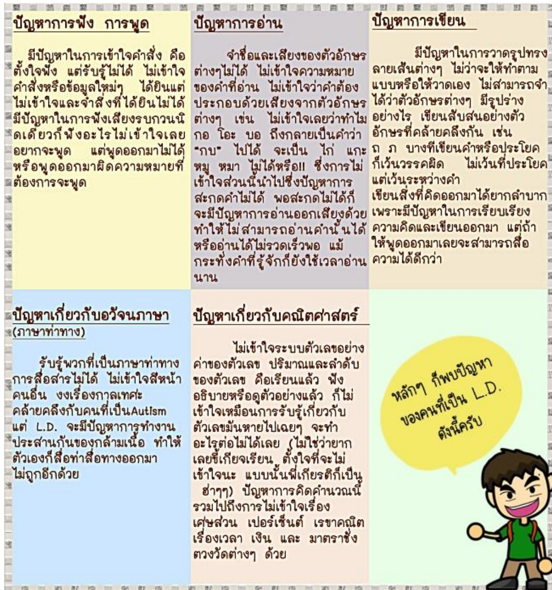
ภาพที่ ๑ ปัญหาของคนที่เป็นแอลดี