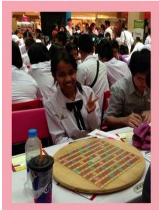
เกียรติบัตร อันดับ ๔ พร้อมกับเหรียญทอง